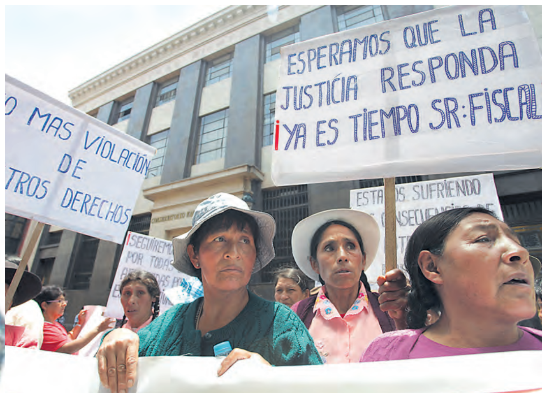
VÍCTIMAS. Mujeres esterilizadas reclaman justicia al Estado Peruano.

El médico Óscar Requena, ex director del Centro de Salud de Santa Rosa (Piura), donde entre el 25 y 29 de agosto de 1997 se hicieron 600 esterilizaciones.