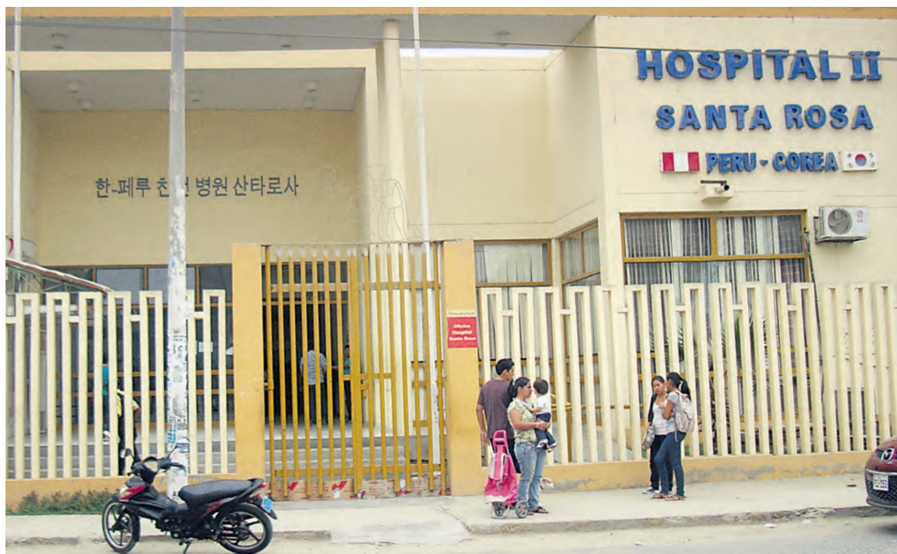
CENTRO DE ESTERILIZACIONES. En 1997, en este local, se cumplió con la "Gran Campaña de Salud" del régimen de Fujimori.

de incrementar las coberturas de Planificación Familiar AQV, realizará mensualmente Grandes Campañas de Atención Integral AQV, con una meta de 150 pacientes cada uno (600 en total por las cuatro zonas de salud durante los cinco días de campaña)", señala el documento.