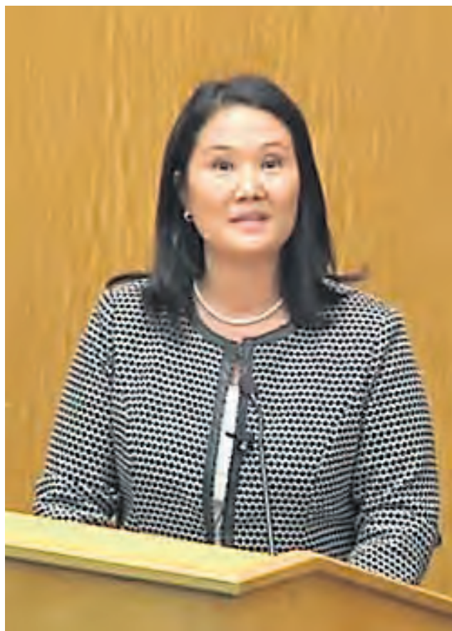
HARVARD. Keiko Fujimori culpó a los médicos por las AQV.

de atención integral cuya meta (es) 250 (intervenciones de) AQV (Anticoncepción Quirúrgica Voluntaria), motivo por el cual deberá hacer las coordinaciones del caso con los establecimientos de su jurisdicción y con el Programa de Planificación Familiar y de esta manera asegurar el éxito de dicha campaña" (ver facsímil del oficio).