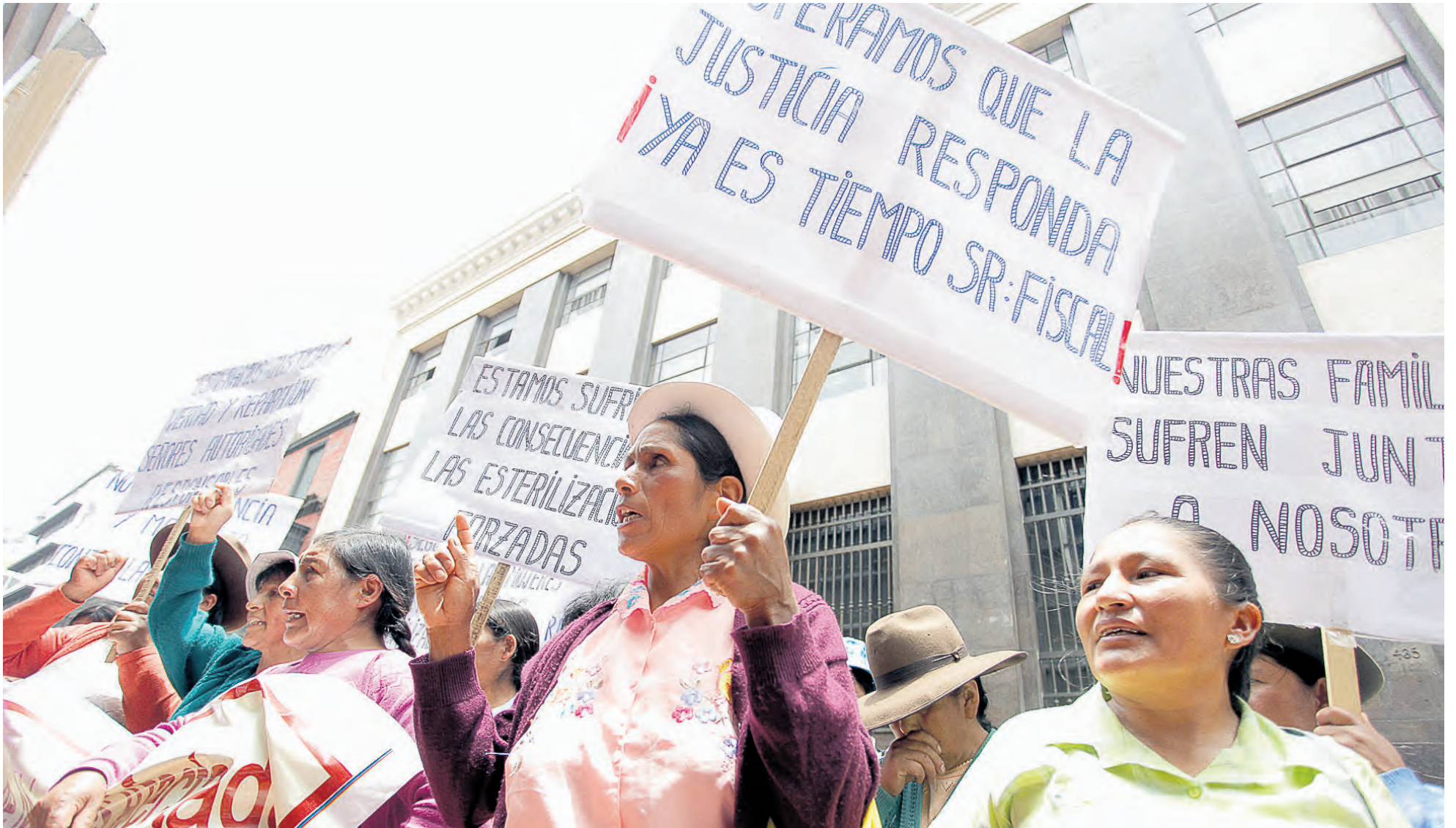
VÍCTIMAS. Según el testimonio de los médicos de Piura, el Ministerio de Salud pagaba a "captadores" de la sierra de Huancabamba para llevar

arlas a los hospitales a fin de esterilizarlas.