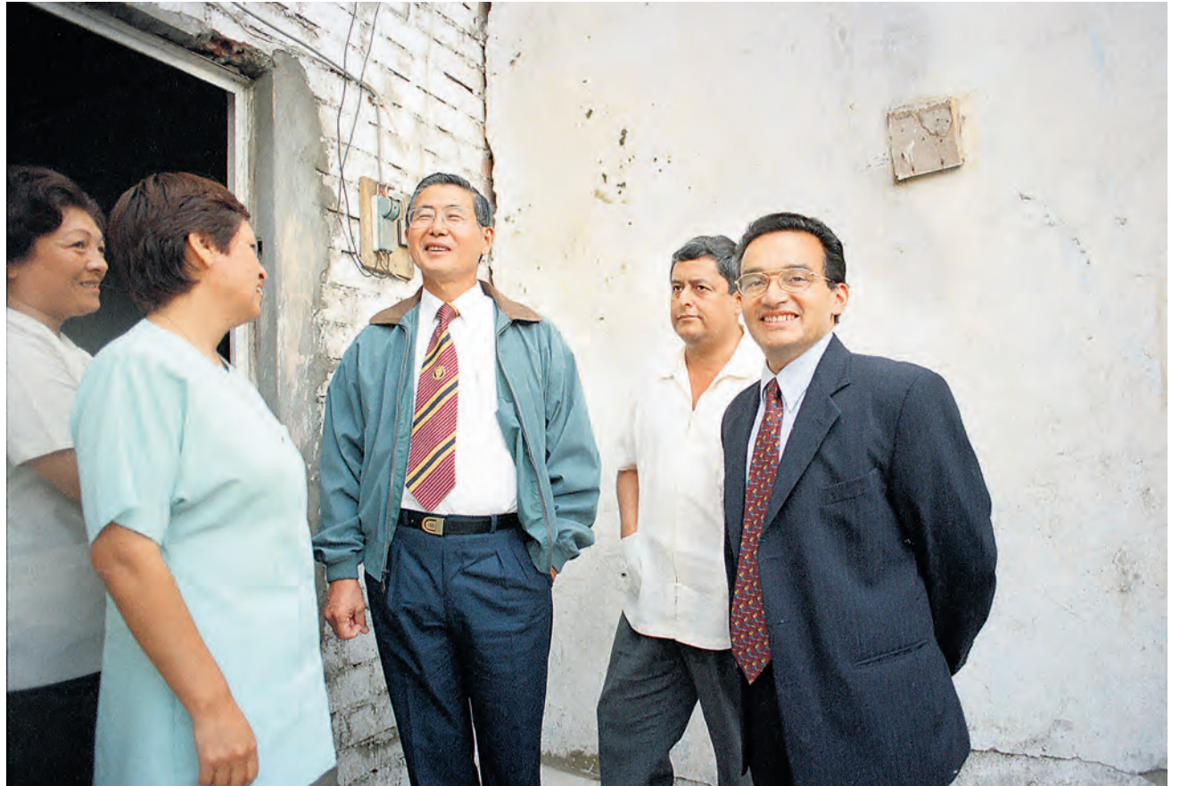
MANDATO. Alberto Fujimori y su ministro de Salud en 1999, Alejandro Aguinaga: esterilizaciones fueron política de Estado.